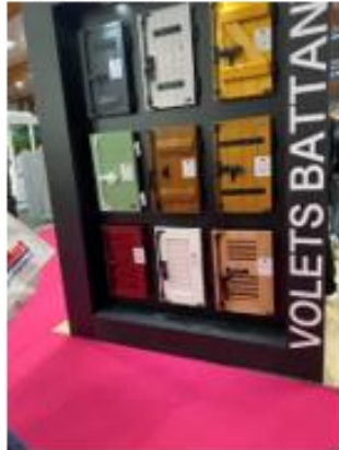
Volets Battants , Artibat, Rennes, 2023. Nous n'avons pas pu demander la moindre information car il y avait trop

Dans ce stand, nous pouvons trouver différents types de volets battants, il y en a en Bois, PVC, Aluminium