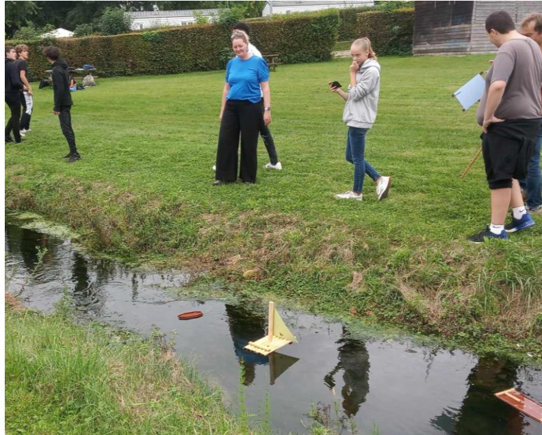
Légende de l'image : la course de bateaux fabriqués par les 1MF en bois

ILS ONT DISPOSE LES BATEAUX POUR FAIRE UNE COURSE, TOUS LES BATEAUX ONT FLOTTE MAIS CERTAINS ETAIENT PLUS LENTS QUE D'AUTRES EN FONCTION DE LEURS POIDS, DE LEURS FORMES... CERTAINS BATEAUX SE SONT BLOQUES PENDANT LA COURSE OU SE SONT RETOURNES.