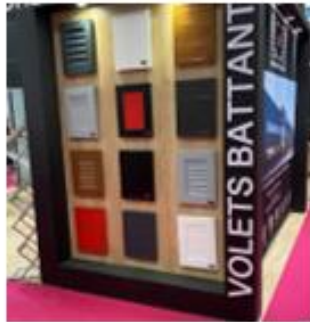
Les volets Battants