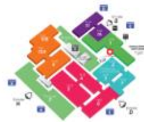
Plan des bâtiments ( Artibat ).