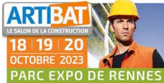
Artibat, Rennes, 2023.